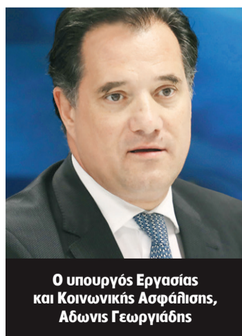
Ο υπουργός Εργασίας και Κοινωνικής Ασφάλισης, Αδωνις Γεωργιάδης